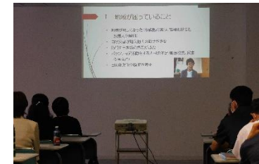
消費者大学校大学院 Web講座