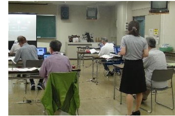
はじめてのパソコン活用術